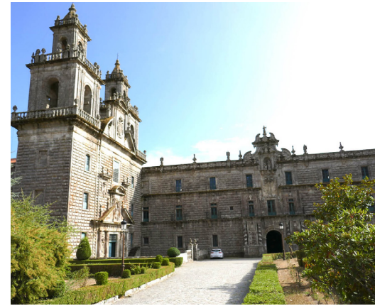
Monasterio de Santa María de Oseira

No nos equivocamos si deducimos que, en aquel hogar, los hijos e hijas aprendieron una sana religiosidad y un trabajo responsable, adecuado a sus fuerzas y posibilidades en todos los aspectos. Conocemos los caminos profesionales de algunos de ellos, todos coronados con cargos de responsabilidad intelectual y de servicios en la sociedad del Madrid del siglo XIX. Y sabemos que no dejaron de ser sanamente coherentes con su fe.