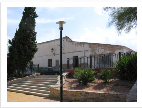
Primeiro colegio do Amor de Deus em Bullas, onde esteve Ir. Rocío.